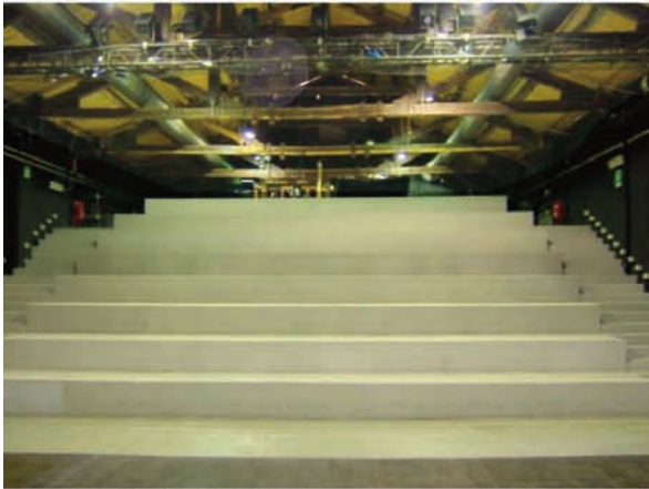
Sala A: tribuna