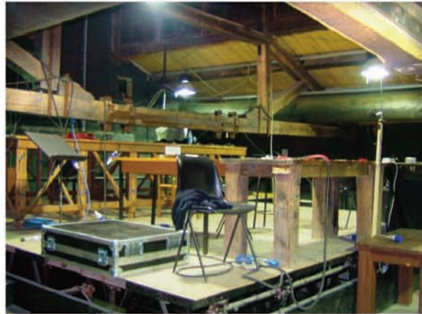
Sala A: controllo luci e suono