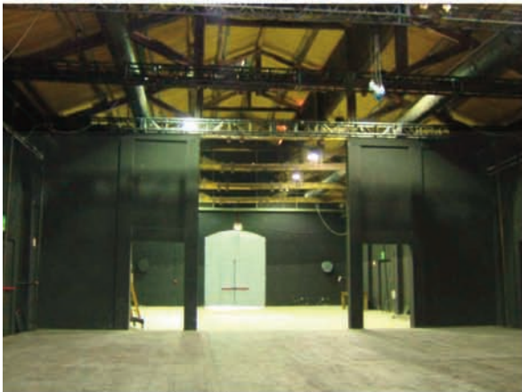
Sala A: palcoscenico