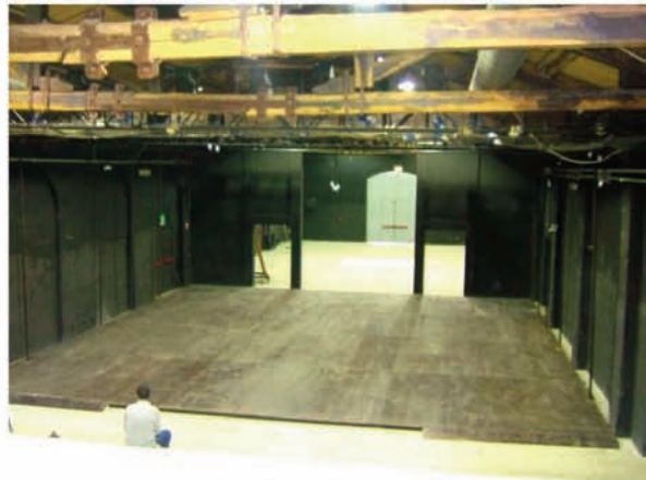
Sala A: palcoscenico