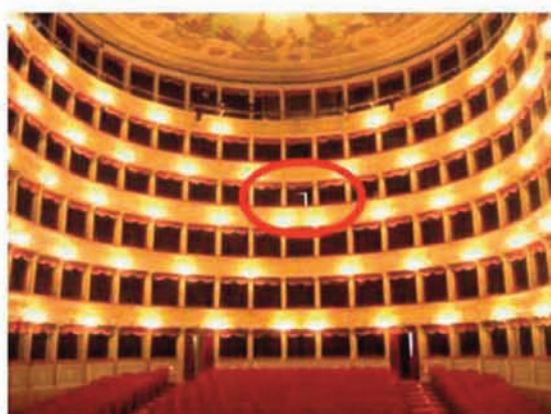
Teatro Argentina: controllo luci e suono