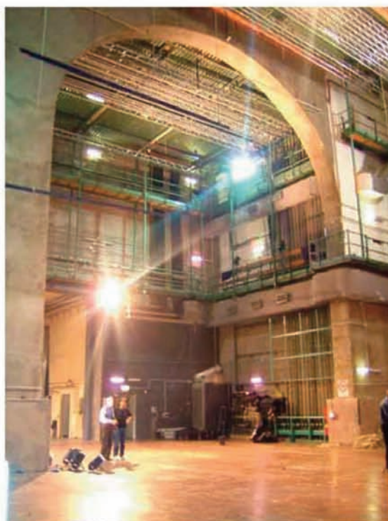
Teatro Argentina: arco