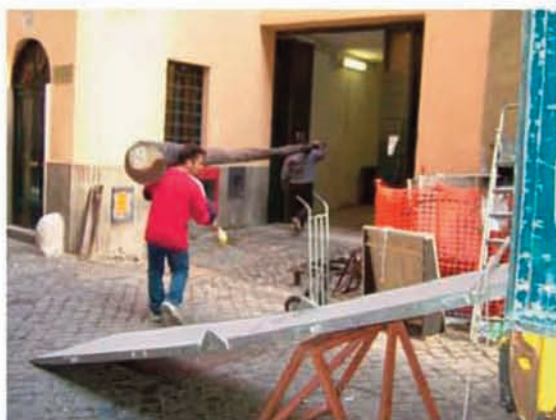
Teatro Argentina: porta di scarico

Porta dello scarico: larghezza: 3.0 m altezza: 3.3 m distanza dal palcoscenico : 20.0 m