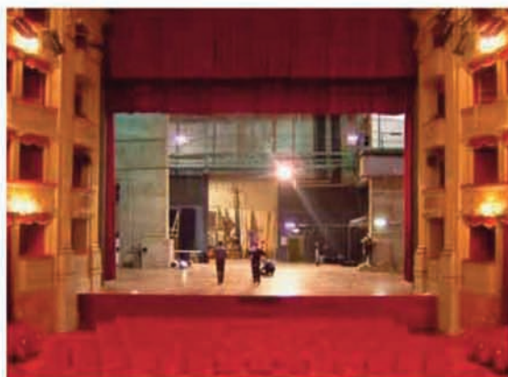
Teatro Argentina: palcoscenico

Sipario: elettrico ; velluto rosso Quinte: 10 - velluto nero 04 m x 10 m Fondale: 1 - velluto nero 10 m x 16 m Soffitti: 5 - velluto nero 03 m x 16 m Altezza palco: 1.05 m Pavimento: legno Botole: 211 – dimensioni 01 x 01 m Altezza sottopalco: 2,20 m Spessore palco: 6,0 cm