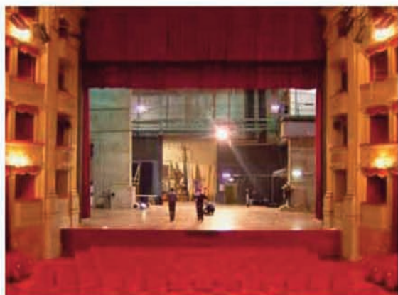
Teatro Argentina: palcoscenico

Sipario: elettrico ; velluto rosso Quinte: 10 - velluto nero 04 m x 10 m Fondale: 1 - velluto nero 10 m x 16 m Soffitti: 5 - velluto nero 03 m x 16 m Altezza palco: 1.05 m Pavimento: legno Botole: 211 – dimensioni 01 x 01 m Altezza sottopalco: 2,20 m Spessore palco: 6,0 cm