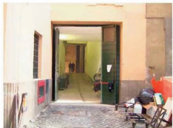
Teatro Argentina: porta di scarico