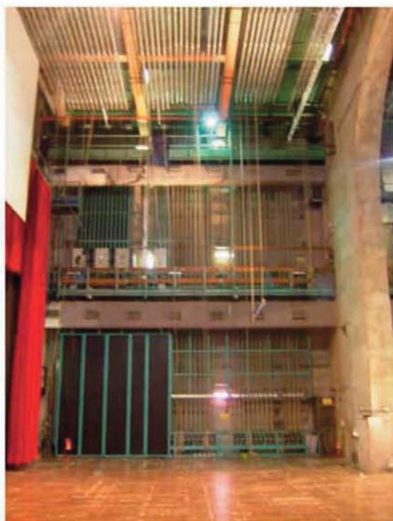
Teatro Argentina: lato sinistro